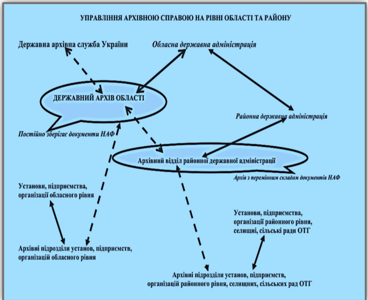
Схема управління архівною справою на регіональному рівні на сучасному етапі

Зусилля Укрдержархіву в умовах реформування спрямовуються на вирішення таких питань: